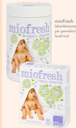
miofresh (disinfettante per pannolini/lavatrice)

Se la macchia persiste, occasionalmente puoi mettere ammollo il nucleo assorbente del tuo pannolino in una soluzione calda di disinfettante miofresh per almeno due ore. Usare 30ml di disinfettante miofresh ogni 5 litri d'acqua. Dopo l'ammollo, lavare a 40°C e, una volta finito, risciacquare ancora una volta i tuoi pannolini.†